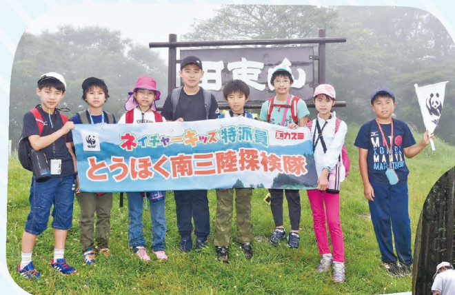
森のトレイルで田東山や 巨石に登りました