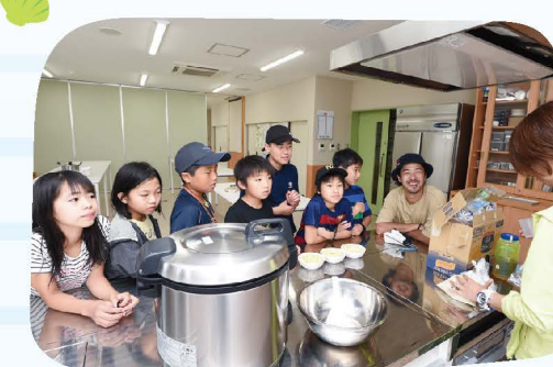
簡単リゾット作りとビジター センターのお掃除