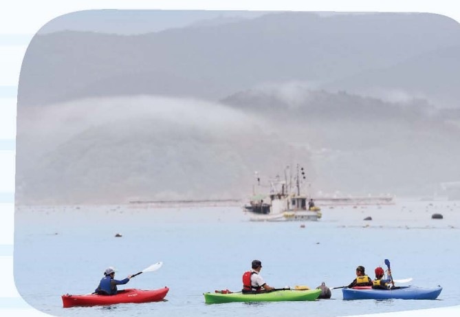
2組に分かれてカヤックと シュノーケリングを体験