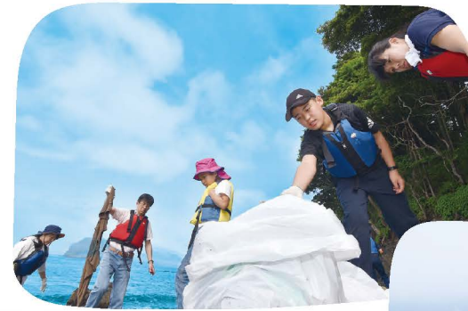
海岸のクリーン活動と 釣り