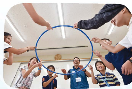
みんなとゲームをしながら、 周辺の自然を学びました。