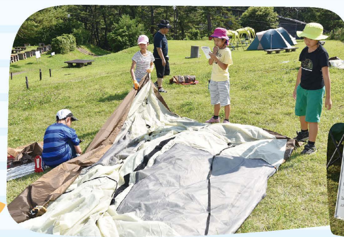
テントの設置から片付けまで体験。 BBQ、カレー作り、はんごうで ごはんも炊きました。