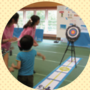
ハンドアーチェリー体験