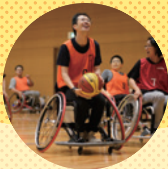
車椅子バスケット体験

みんなが一緒にいきいき暮らせる共生社会実現を目指すため つくば市を中心とした地域で活動する人々や企業・団体などが集まり メッセージを発信していくイベントです。