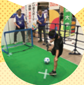
ブラインドサッカー体験