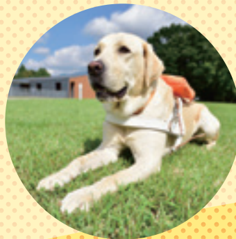
盲導犬ふれあいコーナー