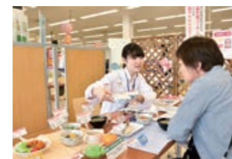
店舗のイートインコーナーを利用した健康測定・栄養アドバイス「ヘルスサポート」