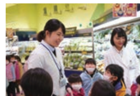
地域の児童・園児が店舗で食べる大切さを学ぶ「スーパーマーケットツアー」