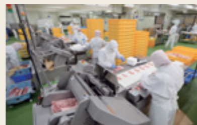
精肉加工センター カスミの店舗に加工肉を供給。茨城県土浦市、千葉県佐倉市の2か所。