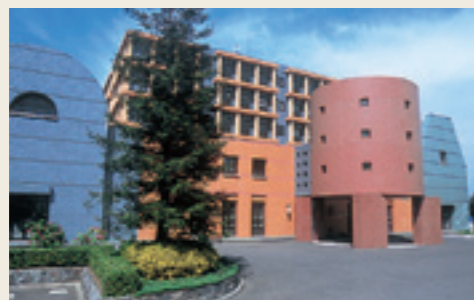
カスミつくばセンター カスミグループの本社。イベント会場として地域の人たちにも開放されています。

* 2021年2月末現在 * 従業員は正社員であり、他にパートナー社員(パートタイマー)及びアルバイトを8,024人(8時間換算・期中平均雇用人員)雇用しております(連結)。