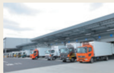
流通センター カスミの物流拠点。茨城県かすみがうら市、桜川市、千葉県佐倉市の3か所。