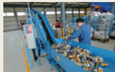
リサイクルセンター 店舗で回収した資源物を選別・圧縮・梱包するリサイクル拠点。茨城県かすみがうら市と千葉県佐倉市の2か所。