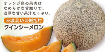
オレンジ色の果肉はなめらかな舌触りで、濃厚な甘い果汁たっぷり。 茨城県JA茨城旭村 クインシーメロン

きめ細かくなめらかな肉質で甘みがしっかりとありながらさっぱりしているのが特徴の青肉系メロンです。全国一のメロン生産量を誇る茨城県の「メロンの王様(キング)として茨城の顔になってほしい」との願いを込めて命名されました。