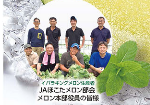
茨城県JAほこた イバラキングメロン

※メロンの価格は店頭にてご確認ください。※メロンは入荷次第の取り扱いとなります。※時期によって取り扱うメロンが異なります。