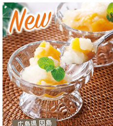
はっさくシャーベット