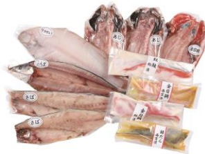
茨城県大洗 森寅 干物・漬魚セット