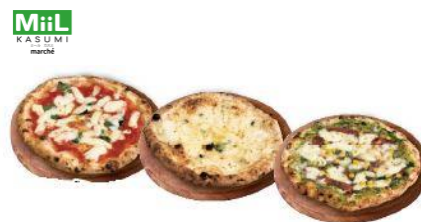
イタリアンレストラン アミーチ 人気のピッツァ詰め合わせ