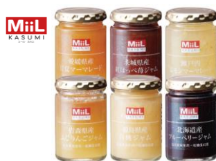
豊かな風味のフルーツジャム Miil ジャムセット