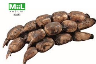
茨城県土浦市・かすみがうら市 掘りたてれんこん（泥付き）

良い日常は、良い食生活から。毎日の食卓を豊かにするカスミオリジナル商品、地域のつながりを大切にしたベストローカルな商品、豊かな生活を演出するこだわりの商品を多数ご用意しました。