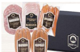
筑波ハム ギフトセット

茨城県銘柄豚「常陸の輝き」を長期間塩漬熟成し、桜の薪でスモークした「筑波ハム」、脂ののった原料を1枚1枚丁寧に手塩にかけてつくった「干物・漬魚セット」、厳選素材にこだわり一つひとつ丁寧な手づくりの「生クリーム大福」などの当社出店エリアの各地域で愛される名品をご用意しています。