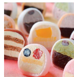
群馬県 丸田屋総本店 生クリーム大福セット 以上