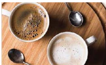
サザコーヒー サザブレンド

単なるイートインではなく、Cafe と Dine の融合した居心地の良い空間で、コーヒーやスイーツ、パスタなどの商品と、サービスを提供し、お客さまのコミュニケーションの場を提供いたします。