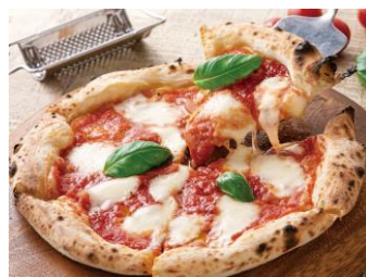
イタリアンレストラン アミーチ 人気のピッツァ詰め合わせ