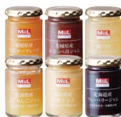
豊かな風味のフルーツジャム Miil ジャムセット