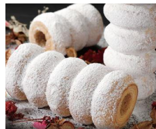
群馬県 GARBA バームクーヘン