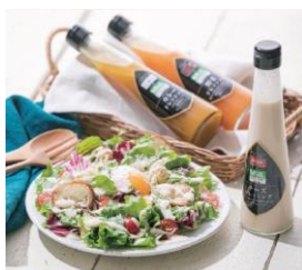
茨城県人気のレストランが監修 Miil ドレッシング詰め合わせ