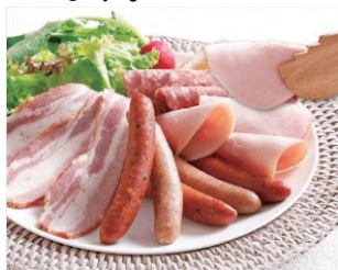
筑波ハム ギフトセット

茨城県銘柄豚「常陸の輝き」を長期間塩漬熟成し、桜の薪でスモークした「筑波ハム」、千葉県「水郷どり」を使用した水郷のとりやさんの「手羽先餃子」、地元の玉子を贅沢に使用した、群馬県利根郡のGARBAの「バームクーヘン」などの当社出店エリアの各地域で愛される名品をご用意しています。