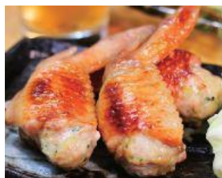
千葉県香取市 水郷のとりやさん 手羽先餃子