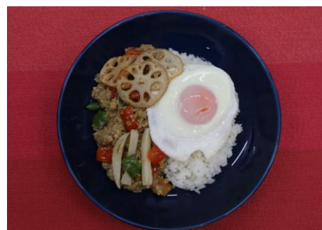
【「いばらきガバオ」調理例】