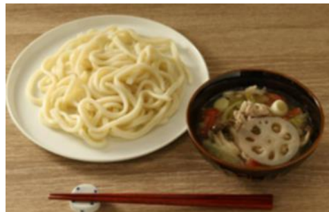
【「ずるびき風うどん」調理例】