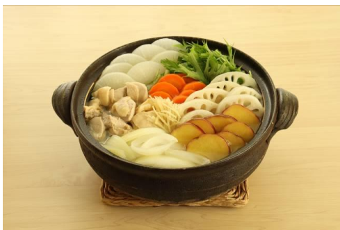
【「白菜とれんこんと小松菜の鶏だし・うま塩鍋」調理例】