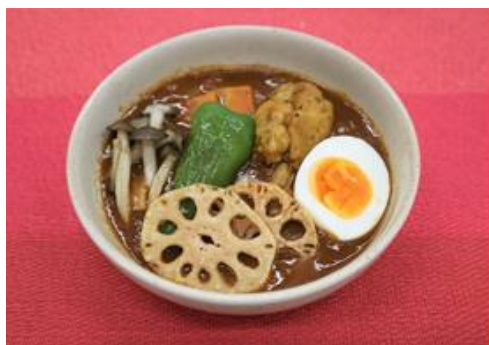
【「れんこんのスープカレー」調理例】