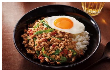
【「いばらきガバオ」調理例】