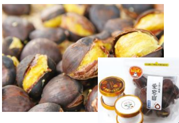
茨城県笠間市 笠間の焼栗 愛樹マロン

日本一の栗の産地笠間市で一ヶ月低温で熟成させた笠間産の焼栗「愛樹マロン」や、千葉県の水郷どりを使用した水郷のとりやさんの「手羽先餃子」、地元の玉子を贅沢に使用した、群馬県利根郡のGARBAの「バームクーヘン」などの当社出店エリアの各地域で愛される名品をご用意しています。