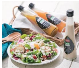
茨城県人気のレストランが監修 Miil ドレッシング詰め合わせ