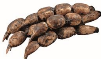
茨城県土浦市・かすみがうら市 掘りたてれんこん（泥付き）