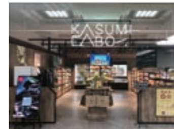
カスミ本社のオフィスマ「KASUMI LABO(カスミラボ)」

専用モバイルアプリを利用したキャッシュレス決済が可能な無人店舗。やさしいバス事業の農産物の出荷・受け取り場所としても機能。