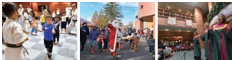
2019年度実施企画。左から「初めての空手」で国際交流! X'mas Townつくば、「音楽の歴史」ムシカヒストリア

カスミ本社を市民活動の交流、文化発信の場として開放し、地域の皆さまの手作り企画の実現をサポートしています。